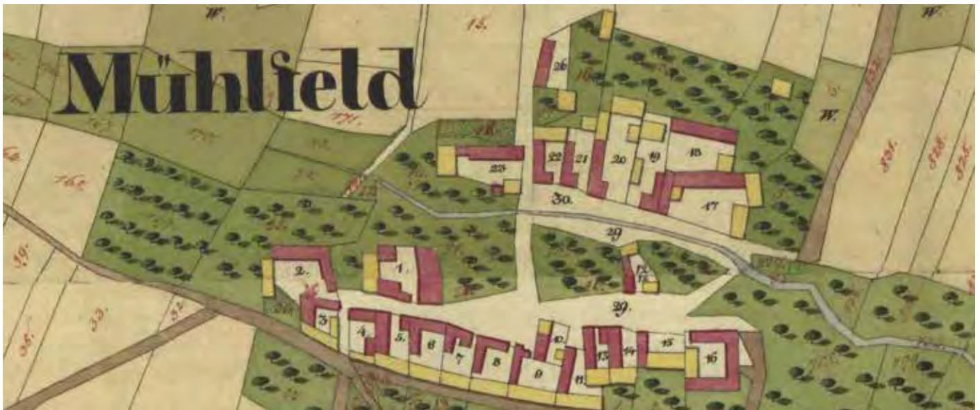
Mühlfeld im Franziszeischen Kataster 1823. Bild zum Mühlfeld-Artikel von Hanns Haas