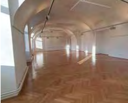
Der Buchstadtsaal: Ein Glanzpunkt im Kunsthaus Horn.

Der Buchstadtsaal im Kunsthaus Horn wurde in den vergangenen Wochen umfassend renoviert und präsentiert sich nun in vollständig modernisiertem Zustand.